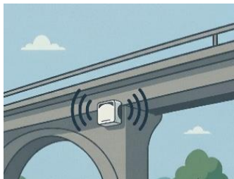
構造物の健全性診断

本製品は、環境振動から簡易地震、構造物振動まで幅広く対応可能なユニークな振動センサーです。建物構造物の健全性診断、簡易地震観測、土木建機・農機・ロボットの動作検出、産業機器の状態監視、高性能防犯用途（破壊行為による異常振動の検出）のような用途に活用いただけます。